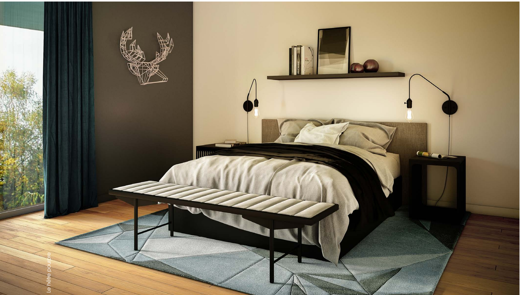
Le hêtre pourpre